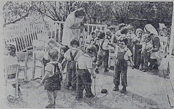
Правительство Чехословацкой Республики проявляет большую заботу о детях. Для них строятся удобные и просторные школы, детские сады, ясли.

На снимке: на веранде детского сада в Братиславе.